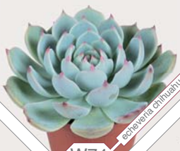
W74 echeveria chinahaitiensis