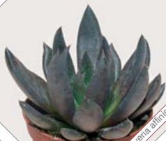
W63 echeveria alina