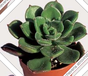
W71 echeveria atrovirens