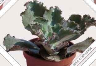
W77 echeveria cr enlata