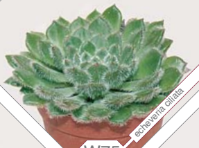
W75 echeveria calia