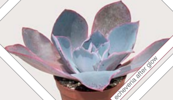
W64 echeveria after glow