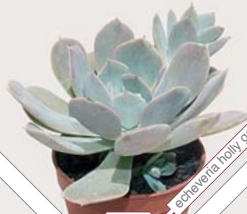
W81 echeveria holly gate