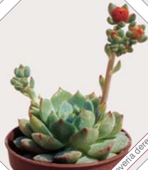
W78 echeveria darentbergii