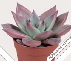
W67 echeveria ezequiel pink