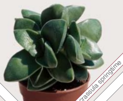
W62 crassula sp.