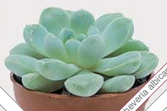
W68 echeveria alricans