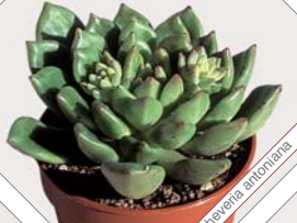
W70 echeveria antonia