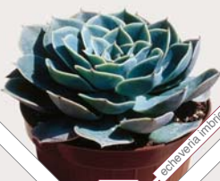
W82 echeveria inornata