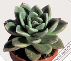
W65 echeveria ezequiel