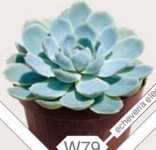
W79 echeveria elegans