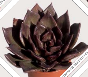
W72 echeveria blackprince