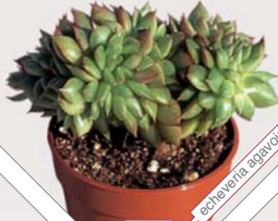
W66 echeveria ezequiel cresta