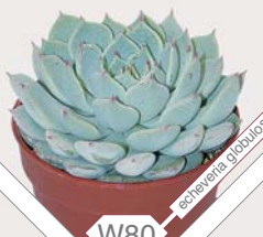
W80 echeveria globulosa