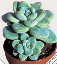
W69 echeveria amoenia